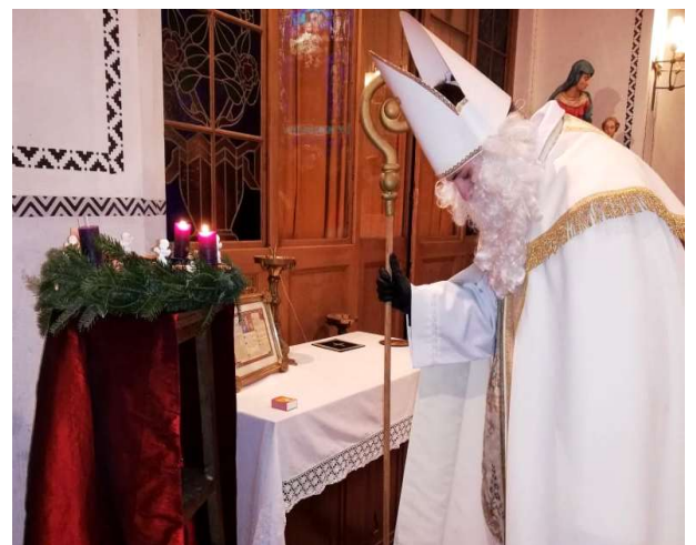
December 6-án, Szent Miklós ünnepén templomunkban az adventi koszorún a második gyertyát a Mikulás gyújtotta meg.