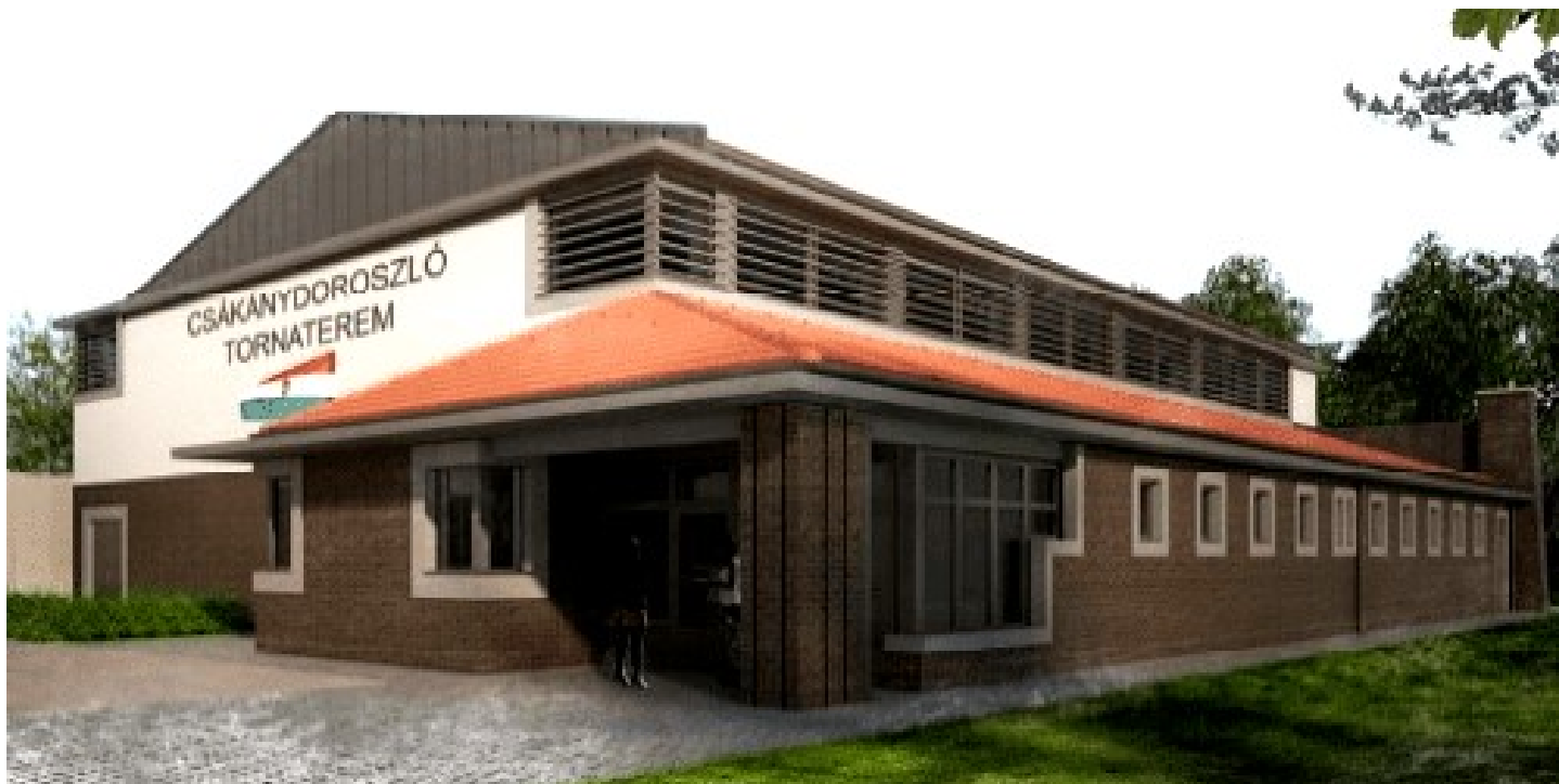
A tornaterem látványterve.

A tornaterem küzdőterének mérete 18x30 méteres kialakítású lesz, 7 méteres belmagassággal. Az előtérből közvetlenül nyílik majd a küzdőtér, a vizesblokk, az öltözők és az elsősegélynyújtó helyiség. A létesítményt ellátó kazánház külön bejárattal fog rendelkezni, itt található majd a füstelvezető, illetve a használati melegvíz tároló tartályok is. A tornacsarnok köré térburkolat is kerül kialakított parkolóhelyekkel.